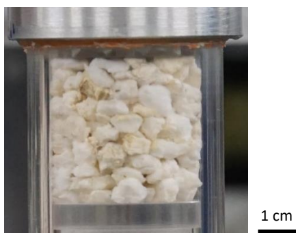
Figure 1 : Empilement de particules de moelle de tournesol (avant compaction)

Des observations par microtomographie à rayons X ont été effectuées au Synchrotron Soleil sur des empilements granulaires biosourcés (sans liant) à différents niveaux de compaction et d'humidité, afin d'étudier l'effet des procédés de mise en œuvre de ces matériaux. Les essais ont porté sur différentes particules végétales, dont des particules de moelle de tournesol (figure 1) qui présentent la particularité d'être très poreuses.